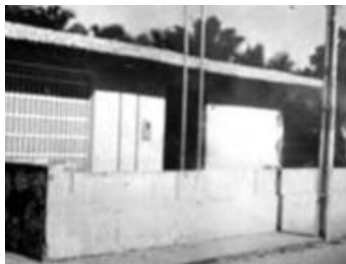
Amaral Lemos, berço cultural de Pirambu

Há 26 anos era lançado na Escola Estadual José Amaral Lemos, em Pirambu, o Grêmio Livre Estudante Janelson Santos, uma iniciativa que será objeto de estudo na instituição.