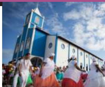
29º Culturarte vai acontecer de 5 a 7 de dezembro

Definida data e tema do 29º Encontro de Cultura, Arte e Conservação de Pirambu. Realizado de forma ininterrupta desde 1991, o CULTURARTE - Encontro de Cultura, Arte e Conservação de Pirambu é o único que em Sergipe ainda não se