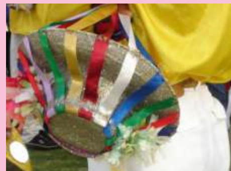
29º Culturarte vai acontecer de 5 a 7 de dezembro

Realizado de forma ininterrupta desde 1991, o CULTURARTE - Encontro de Cultura, Arte e Conservação de Pirambu é o único que em Sergipe ainda não se deixou contaminar pela cultura de massa, sendo um marco de resistência cultural em que a arte é feita e mantida pelo povo. Em sua 29ª edição, este ano será realizado no período de 5 a 7 de dezembro de 2019, tendo como tema definido através de consulta junto ao universo cultural, "Memórias de um rio, história de um povo".